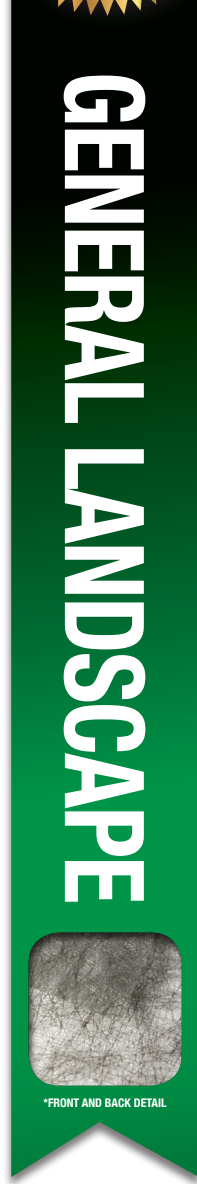
*FRONT AND BACK DETAIL

Cubra con 3 a 4 pulgadas de abono, piedra o corteza para proteger la tela de la luz del sol y para mejorar la apariencia de su proyecto.