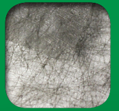
*FRONT AND BACK DETAIL